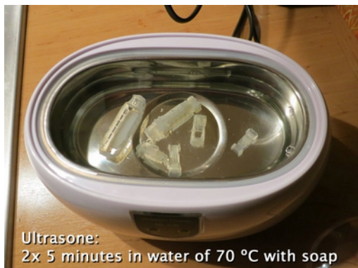
Ultrasone: 2x 5 minutes in water of 70 °C with soap