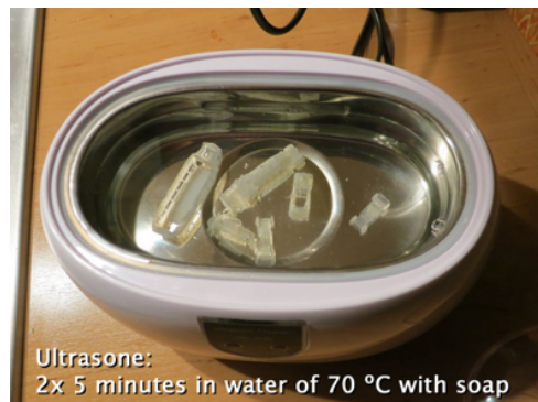
Ultrasone: 2x 5 minutes in water of 70 °C with soap