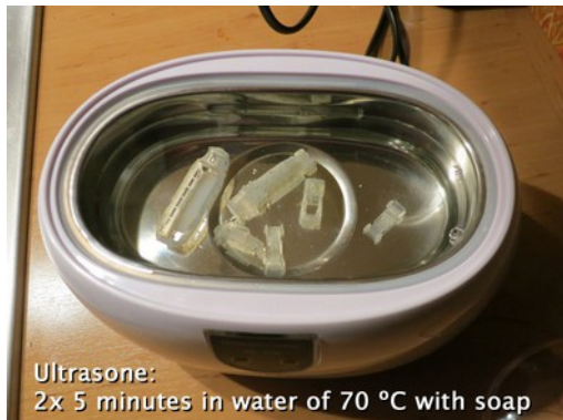
Ultrasone: 2x 5 minutes in water of 70 °C with soap